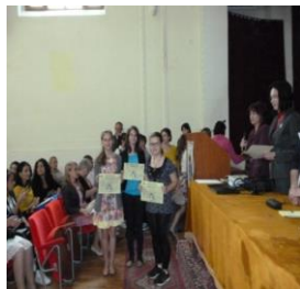
Galați, 1 iunie